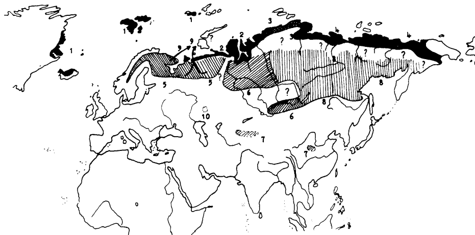
Figuur 2: Verspreiding van Anser fabalis .